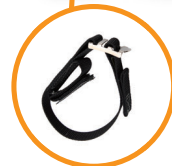
●ランヤード束ね具 R-30