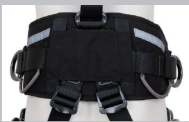
ギアループ 工具吊り用ギアループを 腰部左右 2 箇所に採用